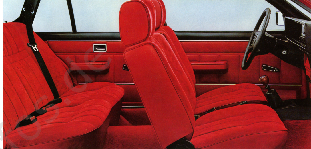
Commodore Voyage Berlina, Innenraum