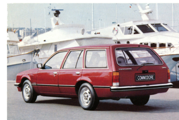
Commodore Voyage Berlina