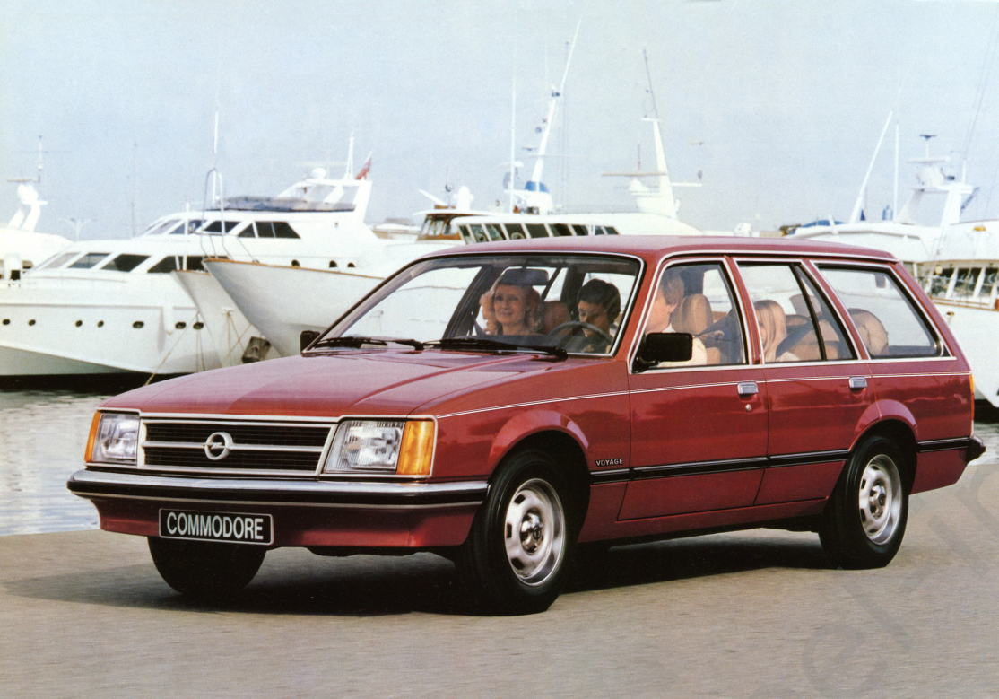
Commodore Berlina Voyage