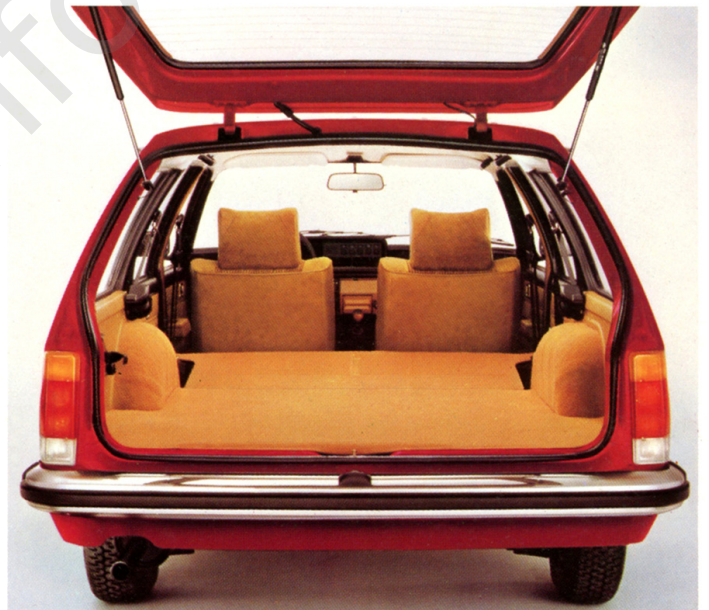
Commodore Voyage, Laderaum