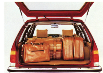
Commodore Voyage Berlina, Laderaum