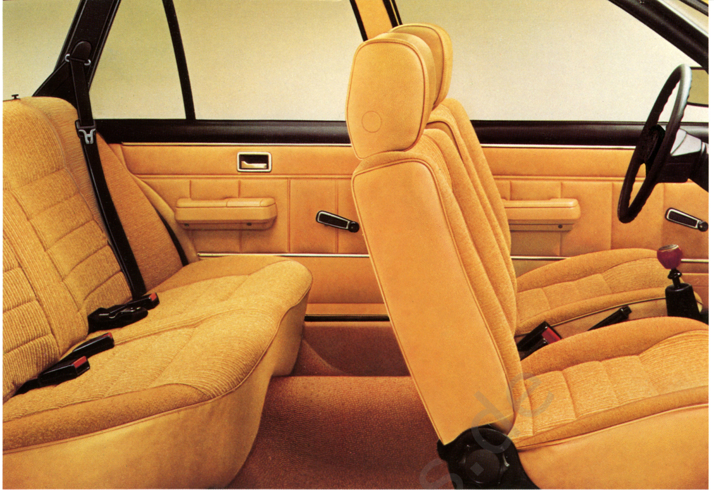
Commodore Voyage, Innenraum